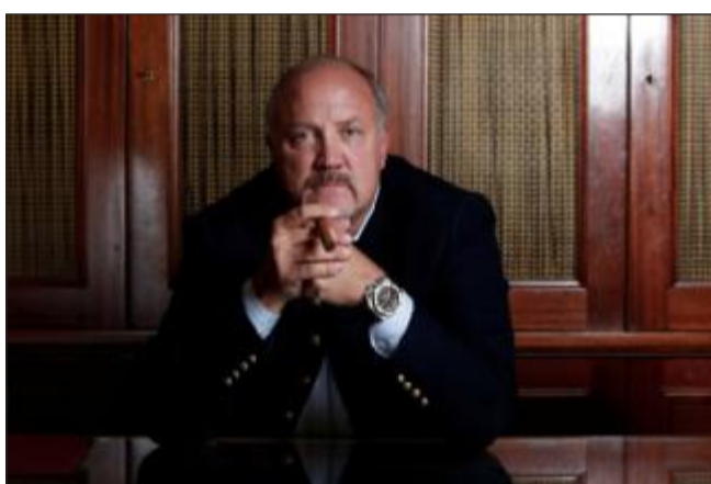
Tidligere UBS-bankmand Bradley Birkenfeld, som fik 104 mio. dollar i whistleblower-belønning, har også skrevet bogen “Lucifer’s Banker”.

Det var alt sammen lovligt nok for Birkenfeld, men det var